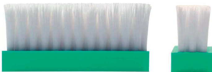
Leistenbürsten mit geschlitztem Besatzmaterial