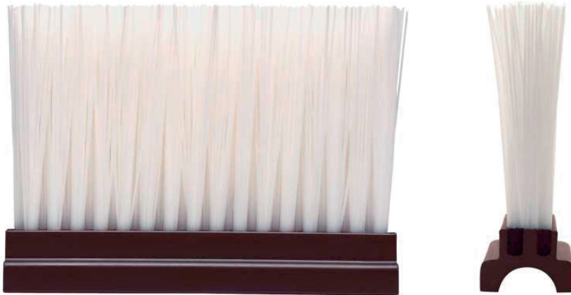
Leistenbürsten mit U-Profil